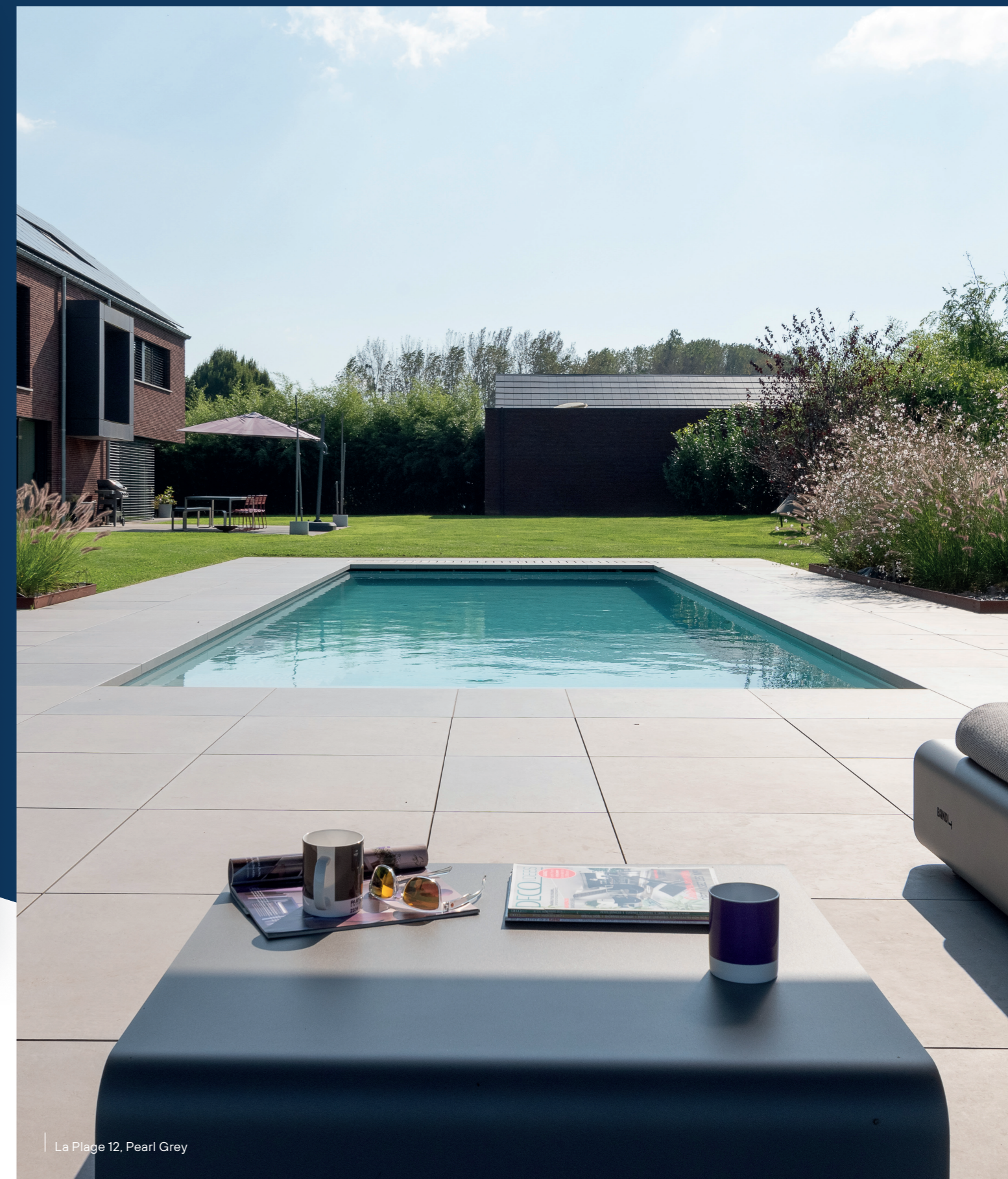
La Plage 12, Pearl Grey